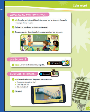
Páginas Coin récré aportan un elemento lúdico al método