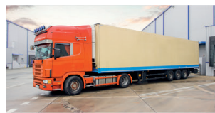
lorry (USA truck) camión