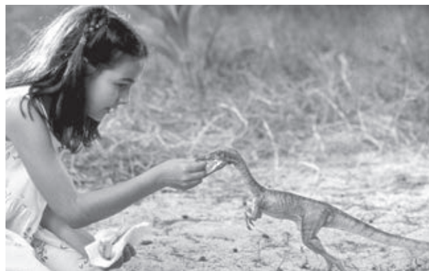
Parque Jurásico (1993), de Steven Spielberg.

En el periodo entre 1912-2008 se han realizado un par de cientos de películas relacionadas con la ciencia de los fósiles. Una revisión permite sugerir tres momentos históricos relevantes. En primer lugar, durante las primeras décadas, el cine paleontológico se refiere básicamente a relatos de nuestros supuestos ancestros (trogloditas prehistóricos) y / o dinosaurios. La década de 1950 constituye el núcleo principal del fenómeno conocido como serie B norteamericana, películas de bajo presupuesto que a veces constituyen pequeñas obras maestras. Por último, el número de filmes vuelve a aumentar en la década de 1990, debido al gran éxito mediático de Parque Jurásico .